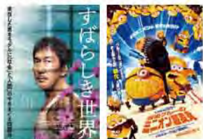
©佐木真三/2021 「すばらしき世界」製作委員会 ©2024 Universal Studios. All Rights Reserved

会場 新館1階 スプリングホール 料金 施設利用料1枚 300円 ※3歳以上有料 ※定員に空きがある場合のみ、当日券を販売します。 予約開始 4月1日(火) 10:00～ ※ご本人以外の席取りはご遠慮ください。