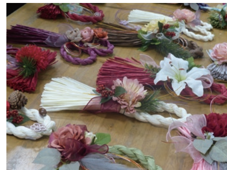
【協力】春日まちづくり支援センター・ぶどうの庭

持参物 グルーガン(お持ちの場合) 申込期間 11月20日(水)~12月10日(火)