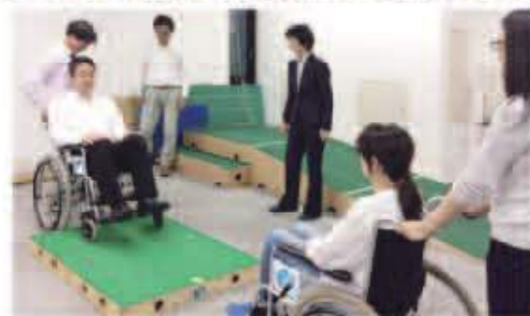
【研修実施主体】公益財団法人日本ケアフィット共育機構