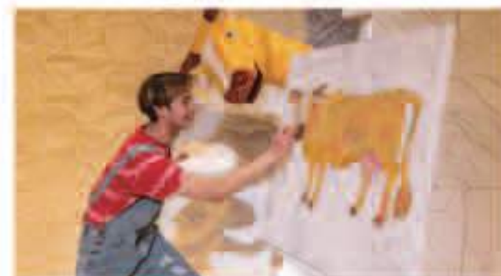
えをかくかくかく

プレイガイド イープラス https://eplus.jp/hungry/ (スマホケ利用可)