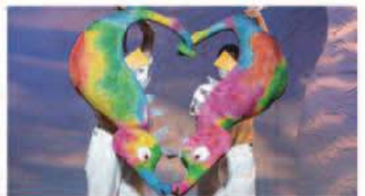
とうさんはタツノオトシゴ