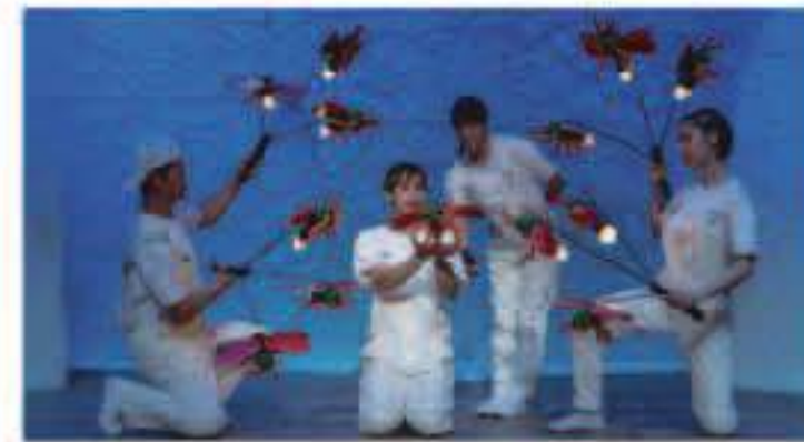
さびしがりやのほたる