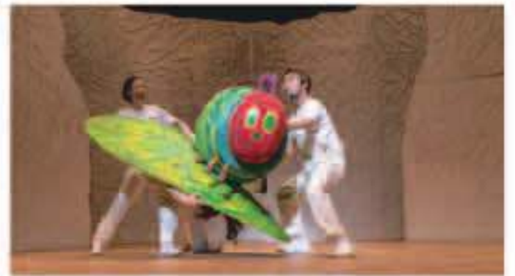
はらぺこあおむし